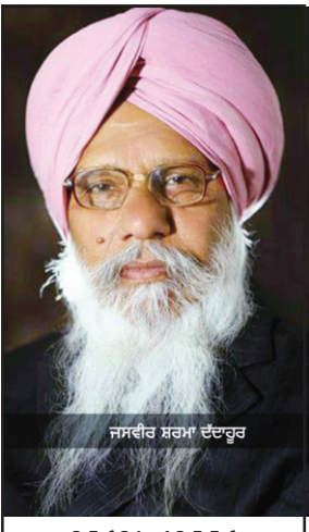
95691-49556 ਸ੍ਰੀ ਮੁਕਤਸਰ ਸਾਹਿਬ

“ਸਵਾਣੀਆਂ ਵਿਆਹਾਂ ਵਿੱਚ ਰੋਟੀਆਂ ਪਕਾਉਣੀਆਂ ਨਾ, ਅਲੱਪ ਹੋਇਆ ਪਿੰਡਾਂ ਵਿੱਚੋਂ ਚੁਰਾ ਦਾ ਰਿਵਾਜ ਜੀ। ਪੈਲੇਸਾਂ ਚ ਕਰ ਲੈਂਦੇ ਉੱਕਾ ਪੁੱਕਾ ਖਾਣਾ ਵਿੱਚੋਂ, ਆਪ ਤੋਂ ਜਿਆਦੇ ਬਹੁਤਾ ਖੋਲ੍ਹੀਏ ਕੀ ਪਾਜ ਜੀ। ਬੀਮਾਰੀਆਂ ਚ ਗੁਜਿਤ ਹੋਇਆ ਸਾਰਾ ਹੀ ਪੰਜਾਬ ਹੁਣ, ਰੱਬ ਵੀ ਤਾਂ ਕਿਸੇ ਨਾਲ ਕਰੇ ਨਾ ਲਿਹਾਜ ਜੀ। ਸੌ ਵਿਚੋਂ ਨੱਬੇ ਬੰਦੇ ਬੁਝੀਆਂ ਬੀਮਾਰ ਰਹਿੰਦੇ ਨੇ ਪੰਜਾਬ ਵਿੱਚ,