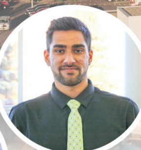
PREZ TIWANA NEW CAR PRODUCT ADVISOR