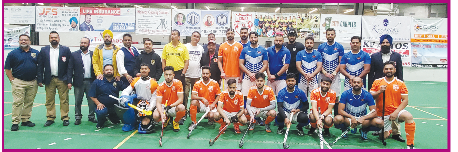
ਕਿੰਗਜ਼ ਅਲੈਵਨ ਹਾਕੀ ਕਲੱਬ ਵੱਲੋਂ ਦੋ ਦਿਨਾਂ ਫੀਲਡ ਹਾਕੀ ਟੂਰਨਾਮੈਂਟ ਕੈਲਗਰੀ ਦੇ ਜੈਨੇਸਿਸ ਸੈਂਟਰ ਦੀਆਂ ਗਰਾਊਂਡਾਂ ਵਿੱਚ ਕਰਵਾਏ ਗਏ