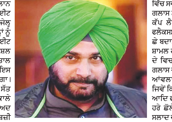
ਇਲਾਵਾ ਦੁਪਹਿਰ ਦੇ ਖਾਣੇ ਵਿੱਚ ਖੀਰ, ਮੱਸਮੀ ਹਰੀਆਂ ਸਬਜ਼ੀਆਂ, ਜਵਾਰ/ਸਿੰਘਰਾ/ਰਾਗੀ ਦੀ ਰੋਟੀ ਦੀ ਸਿਫ਼ਾਰਸ਼ ਕੀਤੀ ਹੈ। ਸ਼ਾਮ ਨੂੰ ਘੱਟ ਫੈਟ ਵਾਲੇ ਦੁੱਧ ਤੋਂ ਬਣੀ ਚਾਹ ਦਾ ਕੱਪ ਅਤੇ ਅੱਧਾ ਨਿੱਝੂ ਦੇ ਨਾਲ 25 ਗ੍ਰਾਮ ਪਨੀਰ ਜਾਂ ਸੋਢਿਆ ਪਨੀਰ ਦੇ ਨਾਲ ਦੇਣ ਲਈ ਕਿਹਾ ਗਿਆ ਹੈ। ਡਾਕਟਰਾਂ ਨੇ ਸਿੱਧੂ ਨੂੰ ਰਾਤ ਦੇ ਖਾਣੇ ਵਿੱਚ ਮਿਕਸਡ ਸਬਜ਼ੀਆਂ, ਦਾਲ, ਸੂਪ ਜਾਂ ਕਾਲੇ ਛੋਲਿਆਂ ਦਾ ਸੂਪ ਅਤੇ ਇੱਕ ਕਟੋਰੀ ਹਰੀਆਂ ਸਬਜ਼ੀਆਂ ਦੇਣ ਲਈ ਕਿਹਾ ਹੈ।

ਪਟਿਆਲਾ (ਪੰਜਾਬੀ ਅਖਬਾਰ ਬਿਊਰੋ)– 34 ਸਾਲ ਪੁਰਾਣੇ ਰੋਡ ਰੇਜ ਕੇਸ ਵਿੱਚ ਪਟਿਆਲਾ ਦੀ ਕੇਂਦਰੀ ਜੇਲ੍ਹ ਵਿੱਚ ਸਜ਼ਾ ਕੱਟ ਰਹੇ ਪੰਜਾਬ ਕਾਂਗਰਸ ਦੇ ਸਾਬਕਾ ਪ੍ਰਧਾਨ ਨਵਜੋਤ ਸਿੰਘ ਸਿੱਧੂ ਨੂੰ ਵਿਸ਼ੇਸ਼ ਡਾਈਟ ਦਿੱਤੀ ਜਾਵੇਗੀ। ਇਸ ਦਾ ਖ਼ਰਚਾ ਸਿੱਧੂ ਖੁਦ ਚੁੱਕਣਗੇ। ਉਨ੍ਹਾਂ ਦੀ ਸਿਹਤ ਦੇ ਮੱਦੇਨਜ਼ਰ ਅਦਾਲਤ ਦੇ ਹੁਕਮਾਂ 'ਤੇ ਬਣੇ ਮੈਡੀਕਲ ਬੋਰਡ ਨੇ ਵਿਸ਼ੇਸ਼ ਡਾਈਟ ਨਿਰਦੇਸ਼ ਕੀਤਾ ਹੈ। ਹਾਲਾਂਕਿ ਇਹ ਡਾਈਟ ਪਲਾਨ ਅਜੇ ਲਾਗੂ ਨਹੀਂ ਹੋਇਆ ਹੈ। ਜੇਲ੍ਹ ਅਧਿਕਾਰੀਆਂ ਦਾ ਕਹਿਣਾ ਹੈ ਕਿ ਉਨ੍ਹਾਂ ਨੂੰ ਸਰਕਾਰੀ ਰਾਜਿੰਦਰਾ ਹਸਪਤਾਲ ਤੋਂ ਡਾਈਟ ਪਲਾਨ ਨਹੀਂ ਮਿਲਿਆ ਹੈ। ਸਪੈਸ਼ਲ ਡਾਈਟ ਖੁਰਾਕ ਯੋਜਨਾ ਨੂੰ ਜੇਲ੍ਹ ਹਸਪਤਾਲ ਦੇ ਡਾਕਟਰ ਹੀ ਫਾਈਨਲ ਪਵੇਗਾ। ਇਸ ਦਾ ਖ਼ਰਚਾ ਸਿੱਧੂ ਨੂੰ ਖੁਦ ਚੁੱਕਣਾ ਪਵੇਗਾ। ਜੇਲ੍ਹ ਨਿਯਮਾਂ ਅਨੁਸਾਰ ਉਨ੍ਹਾਂ ਨੂੰ ਸਵੇਰੇ ਸੱਤ ਵਜੇ ਚਾਹ ਦੇ ਨਾਲ ਬਿਸਕੁਟ ਜਾਂ ਕਾਲੇ ਛੋਲੇ ਦਿੱਤੇ ਜਾਂਦੇ ਹਨ। ਜਿਸ ਤੋਂ ਬਾਅਦ 8.30 ਵਜੇ ਛੋਰੇਟੀਆਂ, ਦਾਲ ਜਾਂ ਸਬਜ਼ੀ ਦਿੱਤੀ ਜਾਂਦੀ ਹੈ। ਇਸ ਤੋਂ ਬਾਅਦ ਸ਼ਾਮ 6 ਵਜੇ ਰਾਤ ਦੇ ਖਾਣੇ ਲਈ 6 ਰੋਟੀਆਂ, ਦਾਲ ਜਾਂ ਸਬਜ਼ੀ ਦਿੱਤੀ ਜਾਂਦੀ ਹੈ, ਪਰ ਸਿੱਧੂ ਫਿਲਹਾਲ ਸਲਾਦ ਅਤੇ ਫਲ ਹੀ ਖਾਂ ਰਹੇ ਹਨ।