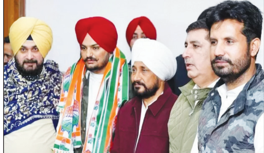
ਇਕ ਪਿੰਡ ਤੋਂ ਕਿਸ ਤਰ੍ਹਾਂ ਤੌਰਕੀ ਕੀਤੀ ਉਸ ਉੱਤੇ ਚਾਨਣਾ ਪਾਉਂਦੇ ਹਾਂ। ‘ਸਾਡਾ ਚੱਲਦਾ ਹੈ ਧੱਕਾ ਅਸੀਂ ਤਾਂ ਕਰਦੇ...’ ‘ਗੱਭਰੂ ’ਤੇ ਕੇਸ ਜਿਹੜਾ ਸੰਜੇ ਦੱਤ ’ਤੇ...’ ‘ਡਾਲਰਾਂ ਵਾਗੂੰ ਨੀਂ ਨਾਮ ਸਾਡਾ ਚੱਲਦਾ, ਅਸੀਂ ਪੁੱਤ ਡਾਕੂਆਂ ਦੇ...’ ਅਜਿਹੇ ਕਈ ਹਿੱਟ ਗਾਣੇ ਗਾਉਣ ਵਾਲੇ ਪੰਜਾਬੀ ਗਾਇਕ ਸਿੱਧੂ ਮੂਸੇਵਾਲਾ ਦਸੰਬਰ 2021 ਦੌਰਾਨ ਕਾਂਗਰਸ ਵਿੱਚ ਸ਼ਾਮਲ ਹੋਏ ਤਾਂ ਇਸ ਖ਼ਬਰ ਦੀ ਚਰਚਾ ਚਾਰੇ ਪਾਸੇ ਹੋਈ। ਗੰਨ ਕਲਚਰ ਨੂੰ ਗੀਤਾਂ ਰਾਹੀਂ ਉਤਾਸ਼ਹਿਤ ਕਰਨ ਦੇ ਇਲਜ਼ਾਮਾਂ ਨੂੰ ਝੱਲਦੇ ਰਹੇ ਮੂਸੇਵਾਲਾ ਦੇ ਪਿਲਾਫ਼ ਅਤੇ ਹੱਕ ਵਿੱਚ ਸੋਸ਼ਲ ਮੀਡੀਆ ‘ਤੇ ਵੀ ਖਾਸੀ ਚਰਚਾ ਹੋਈ।

ਵੱਡਾ ਕਾਰਨ ਹੈ। ਪਹਿਲੀ ਗੱਲ ਇਹ ਕਿ ਜਿਹੜੀ ਪੰਜਾਬ ਕਾਂਗਰਸ ਹੈ ਜਾਂ ਕਾਂਗਰਸ ਹੈ, ਇਸ ਵਿੱਚ ਉਹ ਲੋਕ ਨੇ ਜਿਹੜੇ ਆਮ ਘਰਾਂ ਤੋਂ ਉਠੇ ਹੋਏ ਹਨ। ‘ਮੁੱਖ ਵਜ੍ਹਾ ਇਹ ਹੈ ਕਿ ਇੱਥੇ ਕੋਈ ਵੀ ਮਿਹਨਤਕਸ਼ ਆਦਮੀ ਆਪਣੀ ਆਵਾਜ਼ ਬੁਲੰਦ ਕਰ ਸਕਦਾ ਹੈ ਤੇ ਵਿਕਾਸ ਕਰ ਸਕਦਾ ਹੈ।’