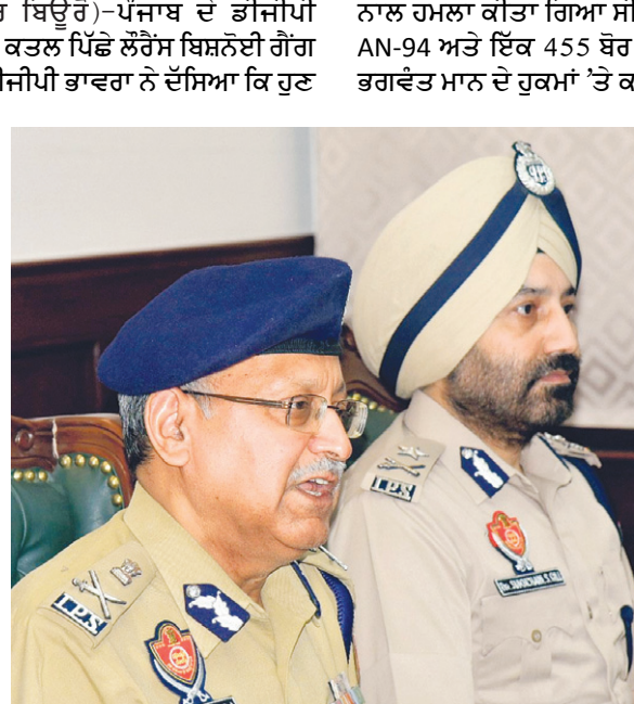
ਨਾਲ ਹਮਲਾ ਕੀਤਾ ਗਿਆ ਸੀ ਜੋ ਵੱਖ ਵੱਖ ਬੋਰ ਦੇ ਸਨ। ਇਨ੍ਹਾਂ 'ਚ AN-94 ਅਤੇ ਇੱਕ 455 ਬੋਰ ਸੀ। DGP ਨੇ ਕਿਹਾ ਕਿ ਮੁੱਖ ਮੰਤਰੀ ਭਗਵੰਤ ਮਾਨ ਦੇ ਹੁਕਮਾਂ 'ਤੇ ਕਾਰਤੂਸਾਂ ਦੀ ਭਾਲ ਲਈ ਐੱਪਰੋਸ਼ਨ ਸ਼ੁਰੂ