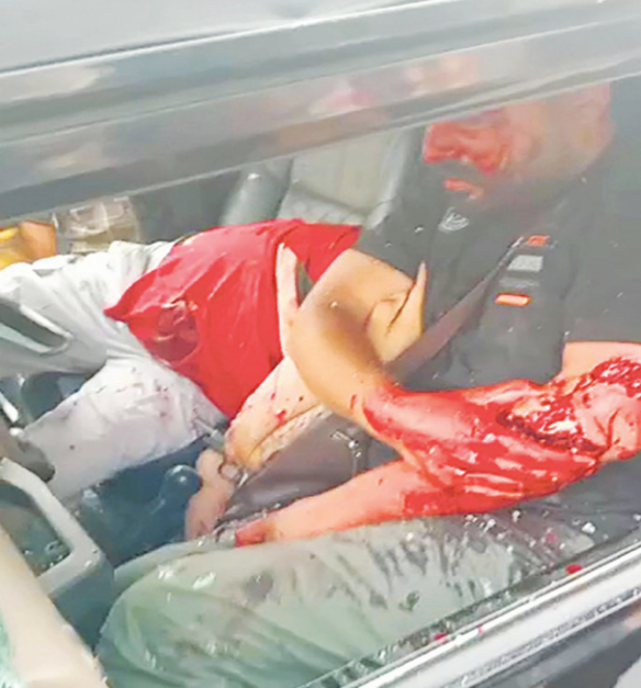
ਗੱਡੀ ਦੀ ਥਾਂ ਬਾਰ ਗੱਡੀ 'ਚ ਜਾਣਾ ਵੀ ਭੇਤ ਡੂੰਘੇ ਕਰ ਰਿਹਾ ਹੈ। ਦੱਸਦੇ ਹਨ ਕਿ ਪਹਿਲਾਂ ਜਦੋਂ ਵੀ ਸਿੱਧੂ ਮੂਸੇਵਾਲਾ ਘਰੋਂ ਬਾਹਰ ਜਾਂਦਾ ਸੀ ਤਾਂ ਉਸ ਨਾਲ ਦੋ ਗੱਡੀਆਂ ਹੋਰ ਵੀ

ਚੰਡੀਗੜ੍ਹ (ਪੰਜਾਬੀ ਅਖਬਾਰ ਬਿਊਰੋ)– ਨੌਜਵਾਨ ਗਾਇਕ ਸਿੱਧੂ ਮੂਸੇਵਾਲਾ ਵੱਲੋਂ ਆਪਣੀ ਸੁਰੱਖਿਆ ਦੀ ਅਣਗਹਿਲੀ ਕੀਤੇ ਜਾਣ ਦਾ ਭੇਤ ਬਣ ਗਿਆ ਹੈ ਜਿਸ ਤੋਂ ਕਈ ਸ਼ੱਕੇ ਖੜ੍ਹੇ ਹੋ ਰਹੇ ਹਨ। ਬੇਸ਼ੱਕ ਪੰਜਾਬ ਪੁਲੀਸ ਵੱਲੋਂ ਉਸ ਨੂੰ ਦਿੱਤੇ 4 ਸੁਰੱਖਿਆ ਕਮਾਂਡੋ 'ਚੋਂ ਦੋ ਵਾਪਿਸ ਲੈ ਲਏ ਸਨ, ਪ੍ਰੰਤੂ ਉਹ ਆਪਣੇ ਨਾਲ ਤਾਇਨਾਤ ਦੋ ਸੁਰੱਖਿਆ ਕਮਾਂਡੋਜ਼ ਨੂੰ ਵੀ ਨਾਲ ਨਹੀਂ ਲੈ ਕੇ ਗਿਆ। ਪਹਿਲਾਂ ਇਹ ਸੁਰੱਖਿਆ ਕਮਾਂਡੋ ਉਸ ਦੇ ਅੱਗ ਸੇਰ ਰਹਿੰਦੇ ਸਨ। ਜਦੋਂ ਸਿੱਧੂ ਮੂਸੇਵਾਲਾ ਘਰੋਂ ਰਵਾਨਾ ਹੋਇਆ ਤਾਂ ਉਸ ਨੇ ਕਮਾਂਡੋਜ਼ ਨੂੰ ਘਰ ਹੀ ਰਹਿਣ ਦੀ ਹਦਾਇਤ ਕਰ ਦਿੱਤੀ। ਸਿੱਧੂ ਮੂਸੇਵਾਲਾ 'ਤੇ ਜਦੋਂ ਹਮਲਾ ਹੋਇਆ ਤਾਂ ਉਸ ਨਾਲ ਉਸ ਦੇ ਤਿੰਨ ਦੋਸਤ ਵੀ ਸਵਾਰ ਸਨ। ਉਹ ਆਪਣੀ ਕਾਲੀ ਬਾਰ ਗੱਡੀ 'ਚ ਘਰੋਂ ਨਿਕਲਿਆ ਹਾਲਾਂਕਿ ਉਸ ਕੋਲ ਬੁਲਟ ਪਰਫ ਡਰੱਗੂਨਰ ਗੱਡੀ ਵੀ ਹੈ ਜਿਸ ਦੀ ਉਹ ਅਕਸਰ ਵਰਤੋਂ ਕਰਦਾ ਸੀ। ਅੱਜ ਉਸ ਵੱਲੋਂ ਬੁਲਟ ਪਰਫ