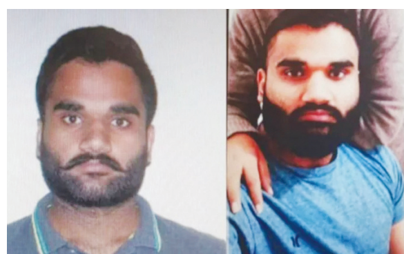
ਮਿੱਟ ਨਾਲ ਇੱਕ ਵੇਲੇ ਦੋ-ਸ਼ੇਰ ਬਰਸਟ ਨਿਕਲਦੇ ਹਨ। ਇਸ ਦੌਰਾਨ ਕੈਨੇਡਾ ਆਧਾਰਿਤ ਗੈਂਗਸਟਰ ਗੋਲਡੀ ਬਰਾੜ ਨੇ ਗਾਇਕ ਤੋਂ ਸਿਆਸਤਦਾਨ ਬਣੇ ਸਿੱਧੂ ਮੂਸੇਵਾਲਾ ਦੀ ਹੱਤਿਆ ਦੀ ਜ਼ਿੰਮੇਵਾਰੀ ਲੈ ਲਈ ਹੈ। ਗੋਲਡੀ ਬਰਾੜ ਗੈਂਗਸਟਰ ਲੋਰੈਂਸ ਬਿਸ਼ਨੋਈ ਦਾ ਨੇੜਲਾ ਸਾਥੀ ਦੱਸਿਆ ਜਾਂਦਾ ਹੈ। ਪੰਜਾਬ ਪੁਲੀਸ ਨੇ ਬੀਤੇ 'ਚ ਇਸ ਗੈਂਗ ਦੇ ਕਈ ਮੈਂਬਰਾਂ ਨੂੰ ਗ੍ਰਿਫਤਾਰ ਕੀਤਾ ਹੈ। ਗੋਲਡੀ ਨੇ ਆਪਣੀ ਡੇਸਬੁਕ ਪੋਸਟ 'ਚ

ਚੰਡੀਗੜ੍ਹ (ਪੰਜਾਬੀ ਅਖਬਾਰ ਬਿਊਰੋ)– ਪੁਲੀਸ ਵੱਲੋਂ ਕੀਤੇ ਦਾਅਵੇ ਮੁਤਾਬਿਕ ਸਿੱਧੂ ਮੂਸੇਵਾਲਾ 'ਤੇ ਅੱਠ ਵਿਅਕਤੀਆਂ ਨੇ ਹਮਲਾ ਕੀਤਾ ਸੀ। ਹਮਲੇ ਵਾਲੀ ਥਾਂ ਤੋਂ ਪੁਲੀਸ ਨੂੰ AN-94 ਹਾਈਡਰਲ ਦਾ ਕਾਰਤੂਸਾਂ ਦੇ ਤਿੰਨ ਖੋਲ ਮਿਲੇ ਹਨ। ਪੰਜਾਬ 'ਚ AN-94 ਹਾਈਡਰਲ ਦੀ ਵਰਤੋਂ ਆਮ ਕਰ ਕੇ ਨਹੀਂ ਹੁੰਦੀ। AN-94 (ਐਵਟੋਮੈਟ ਨਿਕੋਨੋਵਾ ਮਾਡਲ) ਰੂਸੀ ਅਸਾਲਟ ਹਾਈਡਰਲ ਹੈ ਜੋ 1994 ਦਾ ਮਾਡਲ ਹੈ। AN-94 ਨੂੰ AK-74 ਲੜੀ ਦੀਆਂ ਹਾਈਡਰਲਾਂ ਦੇ ਬਦਲ ਵਜੋਂ ਪੇਸ਼ ਕੀਤਾ ਗਿਆ ਸੀ, ਪਰ ਹਾਈਡਰਲ ਦੇ ਗੁੰਝਲਦਾਰ ਡਿਜ਼ਾਇਨ ਕਰ ਕੇ ਇਸ ਨੂੰ ਸਿਰਫ ਵਿਸ਼ੇਸ਼ ਮਿਸ਼ਨਾਂ ਲਈ ਹੀ ਵਰਤਿਆ ਜਾ ਰਿਹਾ ਹੈ। ਗੋਲਡੀ ਨੇ 1,800 ਕਾਰਤੂਸ ਪ੍ਰਤੀ