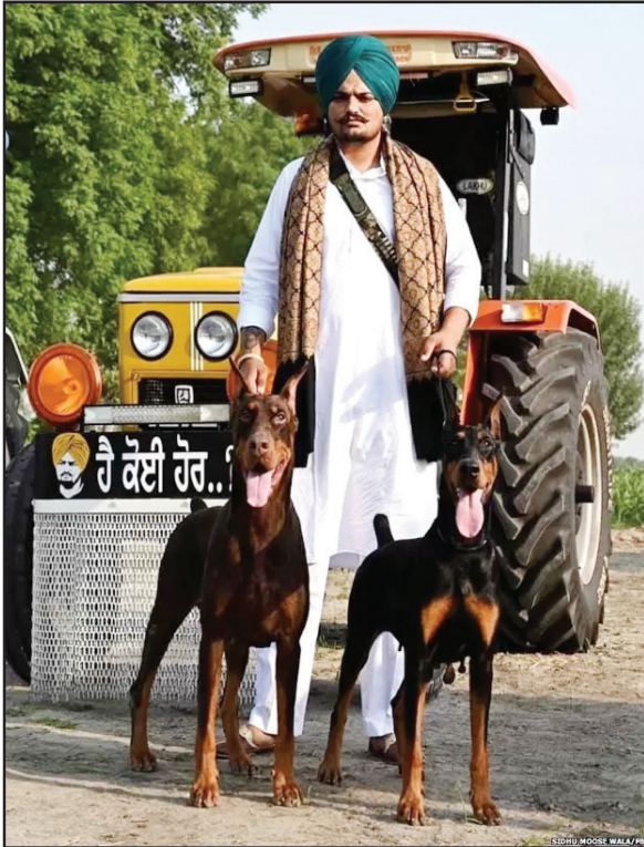
ਚੰਡੀਗੜ੍ਹ (ਪੰਜਾਬੀ ਅਖਬਾਰ ਬਿਊਰੋ)- ਪੰਜਾਬੀ ਗਾਇਕ ਅਤੇ ਅਦਾਕਾਰ ਤੋਂ ਸਿਆਸਤਦਾਨ ਬਣੇ ਸਿੱਧੂ ਮੂਸੇਵਾਲਾ ਦੇ ਕਤਲ ਤੋਂ ਬਾਅਦ ਪੰਜਾਬ ਵਿੱਚ ਇਕ ਤਰ੍ਹਾਂ ਨਾਲ ਤੁਰਾਨ ਆ ਗਿਆ ਹੈ। ਜਿਥੇ ਇਸ ਕਤਲ ਲਈ ਸਿੱਧੂ ਮੂਸੇਵਾਲਾ ਦੇ ਫੈਨ ਸਰਕਾਰ ਨੂੰ ਦੋਸ਼ੀ ਨਹਿਰਾ ਰਹੇ ਹਨ ਉਥੇ ਹੀ ਜਿਹੜੇ ਇਸ ਗਾਇਕ ਦੀ ਗਾਇਕੀ ਪਸੰਦ ਨਹੀਂ ਕਰਦੇ ਸਨ, ਉਹ ਵੀ ਇਹ ਕਹਿੰਦੇ ਹਨ ਕਿ ਇਹ ਬਹੁਤ ਹੀ ਮਾੜਾ ਹੋਇਆ ਹੈ। ਨੌਜਵਾਨ ਪੀੜ੍ਹੀ ਤਾਂ ਖਾਸ ਕਰਕੇ ਇਸ ਸਮੇਂ ਸੋਸ਼ਲ ਮੀਡੀਏ ਉੱਤੇ ਆਪਣੀ ਆਈ ਡੀ ਉੱਤੇ ਮੂਸੇਵਾਲਾ ਦੀ ਤਸਵੀਰ ਲਗਾ ਕੇ ਆਪਣੀ ਸ਼ਰਧਾਂਜਲੀ ਭੇਟ ਕਰ ਰਹੇ ਹਨ। ਇਸ ਘਟਨਾ ਨੇ ਇਕ ਵਾਰ ਫਿਰ ਪੰਜਾਬ ਦੀ ਕਾਨੂੰਨ ਤੇ ਵਿਵਸਥਾ ਉੱਤੇ ਪ੍ਰਭਾਵ ਪੈਣ ਲੱਗਾ ਦਿੱਤੇ ਹਨ ਅਤੇ ਇਕ ਵਾਰ ਫਿਰ ਗੈਂਗਸਟਰਾਂ ਦੇ ਖਾਤਮੇ ਦੇ ਪੁਲਿਸ ਦੇ ਦਾਅਵਿਆਂ ਨੂੰ ਝੂਠਾ ਸਾਬਤ ਕਰ ਦਿੱਤਾ ਹੈ।

ਸਿੱਧੂ ਮੂਸੇਵਾਲਾ ਦੇ ਕਈ ਗੀਤ ਸੁਪਰਹਿੱਟ ਹੋਏ। ਸੋ ਹਾਈ, ਧੱਕਾ, ਉਲਫ਼ ਸਕੂਲ, ਸੰਜੂ ਵਰਗੇ ਗਾਣੇ ਤਾਂ ਯੂਟਿਊਬ ਉੱਤੇ ਕਰੋੜਾਂ ਵਾਰ ਦੇਖੇ ਗਏ। ਇਨ੍ਹਾਂ ਗਾਣਿਆਂ ਰਾਹੀਂ ਬੰਦੂਕ ਸੱਭਿਆਚਾਰ ਨੂੰ ਹੱਲਾਸ਼ੇਰੀ ਦੇਣ ਦੇ ਇਲਾਜ਼ਾਮਾਂ ਤਹਿਤ ਮੂਸੇਵਾਲਾ ਦੀ ਆਲੋਚਨਾ ਵੀ ਹੋਈ ਅਤੇ ਕੇਸ ਵੀ ਦਰਜ ਹੋਏ।