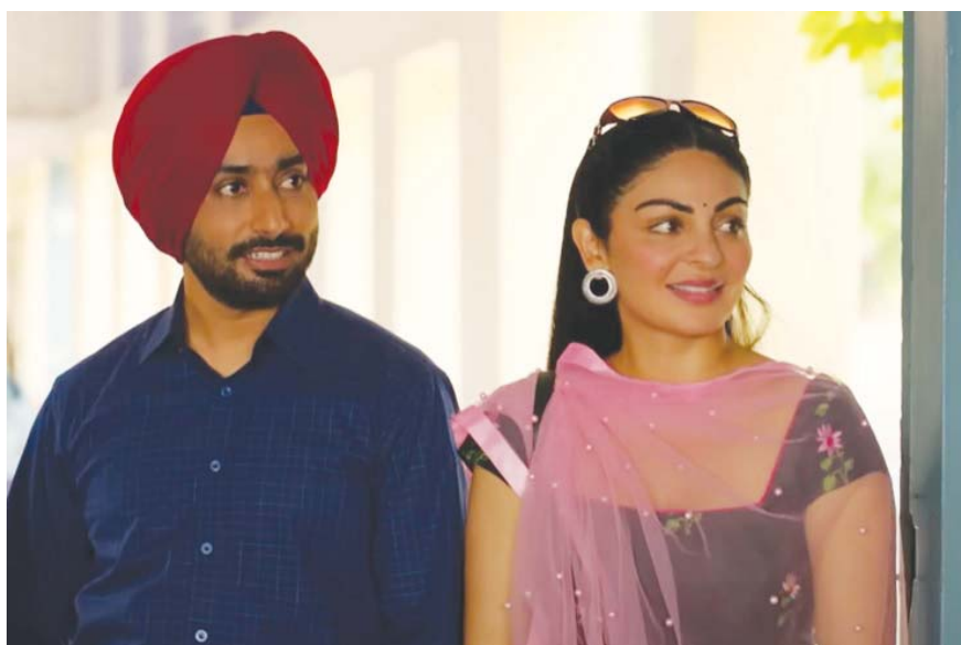
ਸਤਿੰਦਰ ਸਰਤਾਜ ਦੀ 2020 ਵਿੱਚ ਆਈ ਫਿਲਮ ‘ਇੱਕੋ-ਇੱਕੋ’ ਵਾਂਗ ਉਸਦੀ ਇਹ ਨਵੀਂ ਫਿਲਮ

ਦੀ ਫਿਲਮ ‘ਕਲੀ ਜੋਟਾ’ ਹੈ। ਸਿੱਧੇ ਸ਼ਬਦਾਂ ਵਿੱਚ ‘ਕਲੀ-ਜੋਟਾ’ ਇੱਕ ਪੜੀ ਲਿਖੀ, ਨੌਕਰੀਪੇਸ਼ਾ ਔਰਤ ਦੇ ਮਾਨਸਿਕ ਤਣਾਅ ‘ਚ ਉਲਝੇ ਪਿਆਰ ਦੀ ਹਕੀਕਤ ਹੈ। ਹਸੂੰ ਹਸੂੰ ਕਰਦੇ ਚਿਹਰੇ ਦੀ ਮਲਿਕਾ ਰਾਬੀਆ ਜਿਸ ਤੋਂ ਕਿਸੇ ਵੇਲੇ ਫੁੱਲ, ਭੋਰੇ ਹਾਸੇ ਉਧਾਰੇ ਮੰਗਦੇ ਸੀ ਅੱਜ ਕਿਸੇ ਹਾਦਸੇ ਨੂੰ ਦਿਲ ‘ਤੇ ਲਾਈ ਘੋਰ ਉਦਾਸੀ ਦੇ ਆਲਮ ਵਿੱਚ ਡੁੱਬੀ ਬੈਠੀ ਹੈ। ਇਸ ਫਿਲਮ ਵਿੱਚ ਰਾਬੀਆ ਦਾ ਕਿਰਦਾਰ ਨੀਰੂ ਬਾਜਵਾ ਨੇ ਨਿਭਾਇਆ ਹੈ ਜੋ ਉਸਦੀਆਂ ਹੁਣ ਤੱਕ ਆਈਆਂ ਫਿਲਮਾਂ ਤੋਂ ਬਹੁਤ ਹੀ ਹਟਕੇ ਅਤੇ ਚੱਟੋਤੀ ਭਰਿਆ ਹੈ। ‘ਰਾਬੀਆ’ ਆਪਣੀ ਜ਼ਿੰਦਗੀ ਮਰਜ਼ੀ ਨਾਲ ਜਿਉਣ ਦੀ ਇਛੱਕ ਹੈ। ਉਸਦੇ ਸੁਪਨੇ ਵੱਡੇ ਹਨ, ਉਸ ਕੋਲ ਹੋਸਲਾ ਹੈ, ਲਗਨ ਹੈ, ਇੱਕ ਜਨੂੰਨ ਹੈ। ਦੀਦਾਰ (ਸਤਿੰਦਰ ਸਰਤਾਜ)