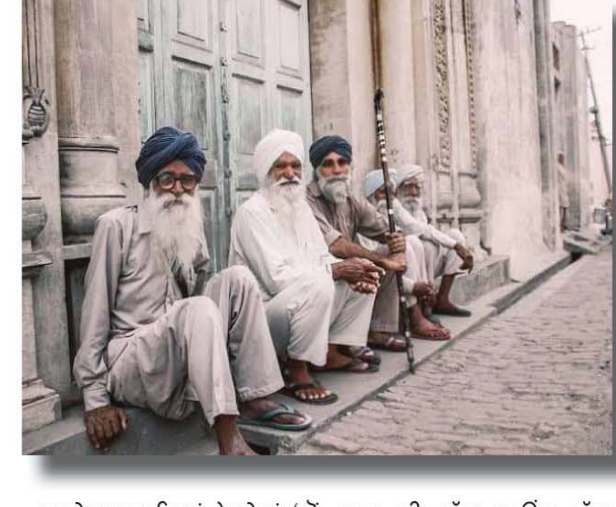
ਦੇ ਪੜਦਾਦਿਆਂ ਨੇ ਖੇਤਾਂ 'ਚੋਂ ਬੁੱਢੀਆਂ, ਖਿੱਪ, ਕਰੀਰ, ਕੰਡੀ ਪੋਹਲੀ ਪੁੱਟੀ ਕੇ ਅਬਾਦ ਕੀਤੇ ਸਨ। ਪਾਈ ਦੀਆਂ ਵਾਰੀਆਂ ਲਈ

ਦੀ ਮਾਲਕੀ ਕਦੋਂ ਤੱਕ ਹੈ? ਕੀ ਤੁਸੀਂ ਆਪਣੇ ਖੇਤਾਂ ਦੀਆਂ ਉਲਟਾਈਆਂ ਜਾਂ ਰਹੀਆਂ ਵੱਲ ਜਾ ਰਹੇ ਮੇਰੇ ਹਰ ਪੰਜਾਬੀ ਭੈਣੇਭਰਾਵੇ ਇੱਕ ਗੱਲ ਜ਼ਰੂਰ ਦੱਸ ਕੇ ਜਾਇਓ ਕਿ ਅਸੀਂ ਤੁਹਾਡੀ ਘਾਟ ਤੇ ਵਿਛੋੜੇ ਨੂੰ ਕਿਵੇਂ ਕਰਕੇ ਲਈਏ? ਕੀ ਤੁਹਾਡੇ ਮੁੜ ਆਉਣ ਦੀ ਉਡੀਕ ਕਰੀਏ ਜਾਂ ਫਿਰ ਤੁਹਾਡੀ ਸੁਖਦ ਵਤਨ ਵਾਪਸੀ ਦਾ ਵਰਕਾ ਪਾੜ ਕੇ ਨਵੇਂ ਕਾਰਜ ਉਲੀਕੀਏ? ਜੇ ਤੁਸੀਂ ਪਰਤੋਂਗੇ ਤਾਂ ਕਦੋਂ ਤੇ ਕਿਸ ਦਿਨ ਦਿਲ ਨਾਲ? ਜੇ ਪੱਕੇ ਤੌਰ 'ਤੇ ਜਲਦ ਵਾਪਸ ਆਉਣ ਦਾ ਕੋਈ ਦਿਹਾੜਾ ਨਹੀਂ ਤਾਂ ਇਕਲੋਤੇ ਬੱਚਿਆਂ ਵਾਲੇ ਪਰਿਵਾਰਾਂ ਦੇ ਪਿੱਛੇ ਰਹਿ ਜਾਂਦੇ ਮਾਪਿਆਂ ਦੀਆਂ ਪ੍ਰੇਸ਼ਾਨੀਆਂ ਤੇ ਇਕਲੋਤਾ ਦਾ ਕੀ ਹੱਲ ਕਰੀਏ? ਵਿਦੇਸ਼ ਗਏ ਨੌਜਵਾਨ ਧੀਆਂ ਪੁੱਤਾਂ ਦੀ ਸੁੱਖ ਸਾਂਦ ਦੇ ਟਿਕਰਾਂ 'ਚ ਬੂਰ ਬੂਰ ਦਿਨੇ ਦਿਨ ਬੁੱਢੇ ਹੋ ਰਹੇ ਦਾਦੇ ਦਾਦੀਆਂ, ਮਾਂ ਬਾਪ ਤੇ ਹੋਰ ਨੇਤਲੇ ਲੋਕਾਂ ਨੂੰ ਕਿਹੜਾ ਦਿਲਾਸਾ ਦੇਈਏ?