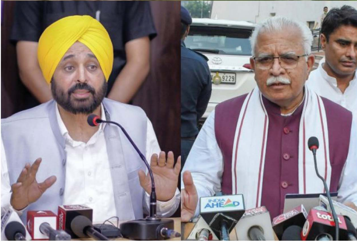
ਪੰਜਾਬ ਦੇ ਮੁੱਖ ਮੰਤਰੀ ਭਗਵੰਤ ਸਿੰਘ ਮਾਨ ਅਤੇ ਹਰਿਆਣਾ ਦੇ ਮੁੱਖ ਮੰਤਰੀ ਚੌਹਾਣ ਨੇ ਸਤਿਲੁਜ-ਯਮੁਨਾ ਲਿੰਕ ਨਹਿਰ ਬਾਰੇ ਦੱਸਦੇ ਹੋਏ ਪੱਤਰਕਾਰਾਂ ਨੂੰ ਸੰਬੋਧਨ ਕਰ ਰਿਹਾ ਹੈ।

ਚੋਤੇ ਕਰਾਉਣਾ ਜ਼ਰੂਰੀ ਹੋਵੇਗਾ ਕਿ ਪੰਜਾਬ ਪੁਨਰਗਠਨ ਐਕਟ 1966 ਦੇ ਪੰਜਾਬ ਨੂੰ ਯਮੁਨਾ ਦਰਿਆ ਦੇ ਪਾਣੀ ਵਿੱਚੋਂ ਬਣਦੇ ਹਿੱਸੇ ਦਾ ਪਾਣੀ ਨਹੀਂ ਮਿਲਦਾ ਰਿਹਾ ਹੈ, ਹਾਲਾਂਕਿ ਪੰਜਾਬ ਰਿਪੇਰੀਅਨ ਸੂਬਾ ਹੈ। ਸੁਆਲ ਤਾਂ ਇਹ ਵੀ ਉਠਦਾ ਹੈ ਕਿ ਜਦੋਂ ਹਰਿਆਣਾ ਰਿਪੇਰੀਅਨ ਸੂਬਾ ਨਹੀਂ ਤਾਂ ਉਹ ਦਰਿਆਈ ਪਾਣੀਆਂ ਦਾ ਹੱਕ ਕਿਸ ਵਜਾ ਨਾਲ ਮੰਗ ਰਿਹਾ ਹੈ? ਹਾਂ, ਇਕ ਗੱਲ ਇਹ ਵੀ ਹੈ ਕਿ ਪੁਨਰਗਠਨ ਐਕਟ 1966 ਦੀ ਧਾਰਾ 78.79 ਅਤੇ 80 ਤਹਿਤ ਪਾਣੀਆਂ ਦੀ ਜਿਹੜੀ ਵੰਡ ਕੀਤੀ ਗਈ ਸੀ ਉਸ ਦੇ ਖਿਲਾਫ ਉਸ ਵੇਲੇ