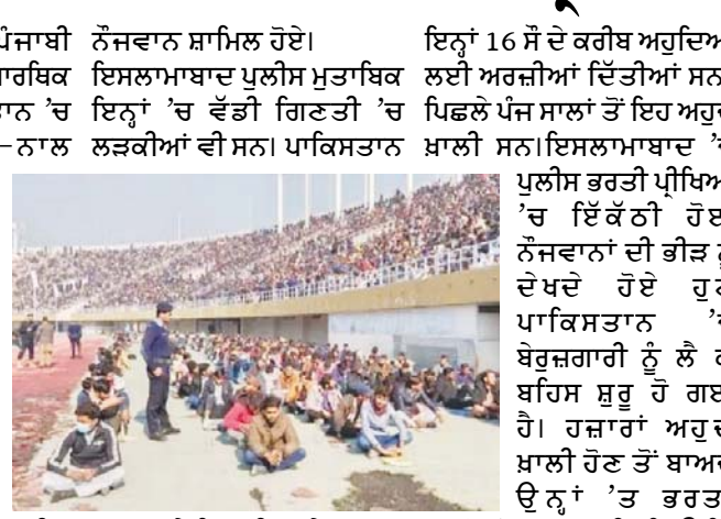
ਇਸਲਾਮਾਬਾਦ ਦੇ ਮੈਦਾਨ 'ਚ ਜ਼ਮੀਨ 'ਤੇ ਬੈਠ ਕੇ ਲਿਖਤੀ ਪ੍ਰੀਖਿਆ ਦੇਣੀ ਪਈ। ਸਿਪਾਹੀ ਭਰਤੀ ਪ੍ਰੀਖਿਆ ਪਿਛਲੇ ਸ਼ਨੀਵਾਰ ਨੂੰ ਇਸਲਾਮਾਬਾਦ ਦੇ ਸਪੋਰਟਸ ਕੈਂਪ ਮੁਸਲਮਾਨਾਂ 'ਤੇ ਵੀ ਹਾਰਦਿਕ ਵਧਾਈ ਪੇਸ਼ ਕੀਤੀ ਹੈ।

ਨੌਜਵਾਨ ਸ਼ਾਮਿਲ ਹੋਏ। ਇਸਲਾਮਾਬਾਦ ਪੁਲੀਸ ਮੁਤਾਬਿਕ ਇਨ੍ਹਾਂ 'ਚ ਵੱਡੀ ਗਿਣਤੀ 'ਚ ਲੜਕੀਆਂ ਵੀ ਸਨ। ਪਾਕਿਸਤਾਨ ਪੁਲੀਸ ਭਰਤੀ ਪ੍ਰੀਖਿਆ 'ਚ ਇੱਕੋ ਠੀ ਹੋਈ ਨੌਜਵਾਨਾਂ ਦੀ ਭੀੜ ਨੂੰ ਦੇਖਦੇ ਹੋਏ ਹੁਣ ਪਾਕਿਸਤਾਨ 'ਚ ਬੇਰੁਜ਼ਗਾਰੀ ਨੂੰ ਲੈ ਕੇ ਬਹਿਸ ਸ਼ੁਰੂ ਹੋ ਗਈ ਹੈ। ਹਜ਼ਾਰਾਂ ਅਹੁਦੇ ਖ਼ਾਲੀ ਹੋਣ ਤੋਂ ਬਾਅਦ ਉਨ੍ਹਾਂ 'ਤੇ ਭਾਰਤੀ ਨਹੀਂ ਹੋ ਪਾ ਰਹੀ ਕਿਉਂਕਿ ਸਰਕਾਰ ਕੋਲ ਪੈਸਾ ਨਹੀਂ। ਅਜਿਹੇ 'ਚ ਜਦੋਂ ਵੀ ਕੋਈ ਸਰਕਾਰੀ ਹੁੰਦੀ ਹੈ ਤਾਂ ਹਜ਼ਾਰਾਂ-ਲੱਖਾਂ ਦੀ ਗਿਣਤੀ 'ਚ ਨੌਜਵਾਨ ਇਨ੍ਹਾਂ 'ਚ ਭਰਤੀ ਹੋਣ ਲਈ ਨਿਕਲ ਪੈਂਦੇ ਹਨ।