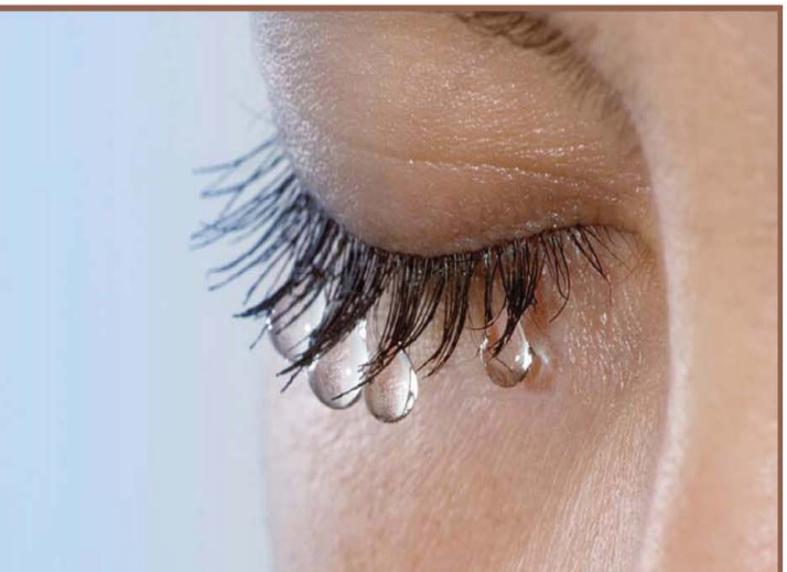
ਆਸੁਓ ਕੀ ਖ਼ਬਰ ਆਖੋ ਕੇ ਭੀ ਨਹੀਂ ਹੋਣੇ ਦੋਤੇ ਕਹਿੰਦੇ ਹਨ ਮਾਪੇ ਦੇ ਵਾਰ ਰੋਂਦੇ ਨ - ਘੀ ਨੂੰ ਤੋਰਨ ਵੇਲੇ ਅਤੰ ਦੁਜਾ ਪੁੱਤਰ ਦੇ ਮੂੰਹ ਮੇੜਨ ਨੇਵੇ। ਮਾਪਿਆਂ ਦੇ ਹੋਣੇ ਦੀ ਭਿਣਕ ਵੇਲੇ ਪੁੱਤਰ ਨੂੰ ਕੀ ਨਹੀਂ ਪੈਂਦੀ, ਪਰ ਇੱਕ ਬੱਚੇ ਦੀ ਕਿਲਕਾਰੀ ਸ਼ੁੱਰੀ ਇਮਾਰਤ ਵਿਚ ਭਜਜ਼ ਪਾ ਰਖਦੀ ਹੈ। ਕੋਈ ਪਲੰਬਰ ਜਿੰਨਾ ਮਰਜੀ ਮਾਹਿਰ ਹੋਏ ਅੱਖਾਂ ਤੋਂ ਟਪਕਦਾ ਪਾਈ ਨਹੀਂ ਹਟਾ ਸਕਦਾ।

ਸੱਚ ਜਾਇਦ ਉਸ ਨੇ ਬਹੁਤ ਕੁੱਝ ਖੋਇਆ ਹੋਵੇਗਾ। ਹੋਣ ਸਮੇਂ ਸਾਡੀ ਮਾਨਸਿਕਤਾ ਗੰਭੀਰ ਹੋ ਕੇ ਹੋਰਨਾਂ ਤੋਂ ਪਾਸਾ ਵਟਦੀ ਹੈ, ਗੱਚ ਭਰਦਾ ਹੈ, ਬੋਲ ਬਿੜਕਦੇ ਹਨ, ਅਸੀਂ ਹੋਰਨਾਂ ਤੋਂ ਛੁਪਦੇ ਹਾਂ। ਇਸ ਲਈ ਹਰੀਵੱਸ ਰਾਏ ਬੱਚਨ ਦੇ ਸ਼ਬਦ ਹਨ - ਆਸੁਓ ਕੇ ਬਹੁਤ ਸਮਝਾਇਆ ਤਨਾਹੀ ਮੈਂ ਆਪਾ ਕਰੀ ਮਹਿਫਿਲ ਮੇਂ ਮੇਰਾ ਮਜ਼ਾਕ ਨੂੰ ਉਡਾਯਾ ਕਰੋ। ਪਰ ਜਦੋਂ ਅੰਦਰ ਕਾਲੇ ਬੱਦਲ ਛਾਏ ਹੋਣ, ਤੇ ਲੈਣਾ ਹੀ ਮਨ ਨੂੰ ਹਲਕਾ ਕਰਦਾ ਹੈ। ਕਿਸੇ ਦੇ ਹਮਦਰਦ ਬੋਲ, ਮੇਰੇ ਤੋਂ ਬਾਹਰ ਜਾਂ ਹੱਥੂ ਕੇਰਨ ਲਈ ਦਿੱਤਾ ਕੰਨਾਂ ਫਿਰ ਜਿਉਣ ਜੋਗਾ ਕਰ ਦਿੰਦਾ ਹੈ। ਇੱਕ ਵੇਰ ਯੁਨੀਵਰਸਿਟੀ ਵਿਚ ਮੇਰੇ ਕੋਲ ਆ ਕੇ ਲੋਕਾਂ ਤੋਂ ਚੋਰੀ ਹੋਇਆ ਇੱਕ ਜਵਾਨ ਮੁੰਡਾ, ਜੋ ਉਧੌਰੋਂ ਸਾਵਾਂ ਦਿਸਦਾ ਸੀ, ਮੈਨੂੰ ਕਦੇ ਨਹੀਂ ਭੁੱਲਿਆ। ਉਸ ਦੀ ਭੈਣ ਨੂੰ ਵਿਆਹੀ ਨੂੰ ਕੁੱਲ ਚਾਰ ਮਹੀਨੇ ਹੋਏ ਸਨ ਕਿ ਉਸ ਦਾ ਘਰ ਵਾਲਾ, ਜੋ ਮੇਰਾ ਵਿਦਿਆਰਥੀ ਸੀ, ਰੱਬ ਨੇ ਉਸ ਤੋਂ ਖੋਹ ਲਿਆ। ਮੁੰਡਾ ਮੇਰੇ ਮੇਜ਼ ਤੇ ਸਿਰ ਰੱਖ ਕੇ ਭੁੱਬ ਆ ਕੇ ਅੱਡਾਂ ਦਾ ਰੋਇਆ। ਮੈਂ ਮਸਾਂ ਵਿਚਾਇਆ ਅਜਿਹੇ ਸਮੇਂ ਮਾਂ ਦੀ ਝੁੱਕਲ ਦਾ ਨਿੱਘ ਯਾਦ ਆਉਂਦਾ ਹੈ। ਅਸੀਂ ਉਠਦੇ ਹੋਏ ਪੰਜ ਹੱਦੇ ਹਾਂ। ਪਰ ਲੇਖਕ ਲੋਕ ਹੋਣਾ ਛੁਪਾ ਲੈਣ ਦੇ ਮਾਹਿਰ ਹੁੰਦੇ ਹਨ। ਸ਼ਬਦ ਗੁੱਲਣਯੋਗ ਨ ਨ - ਸਾਇਰ ਲੋਗ ਕੋਝ ਕਮਾਲ ਹੋਤੇ ਹੈ, ਕਠੀ ਅਪਨੇ