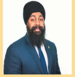
MP JASRAJ HALLAN