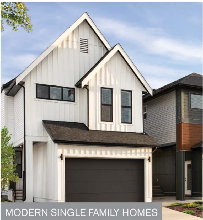
MODERN SINGLE FAMILY HOMES