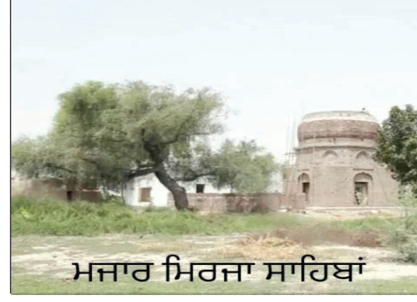
ਮਜ਼ਾਰ ਮਿਰਜਾ ਸਾਹਿਬਾਂ