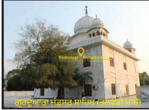
ਗੁਰਦੁਆਰਾ ਜੰਡਸਰ ਸਾਹਿਬ (ਤਲਵੰਡੀ ਸਾਬੋ)