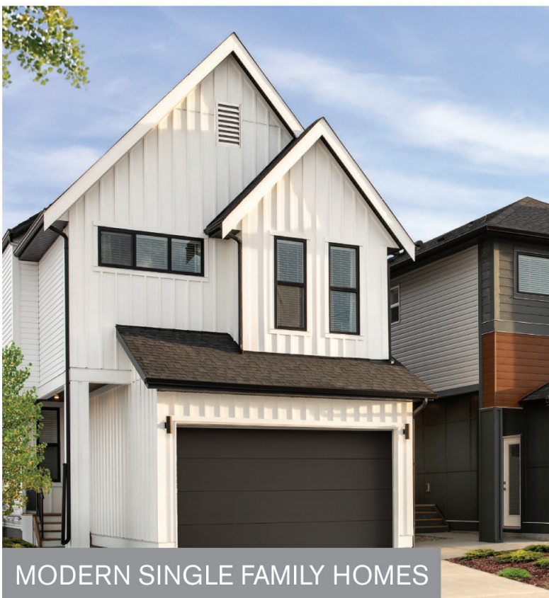
MODERN SINGLE FAMILY HOMES