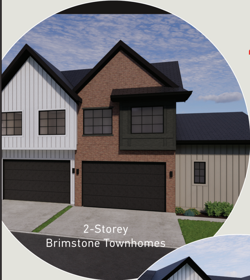
2-Storey Brimstone Townhomes