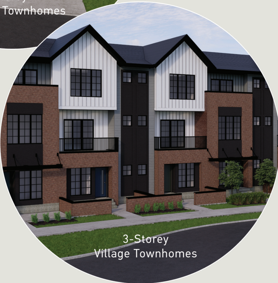
3-Storey Village Townhomes