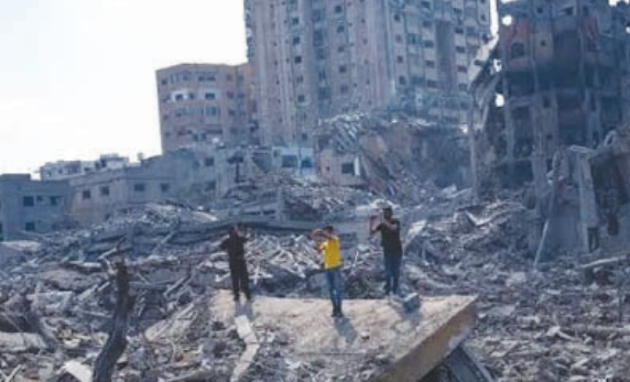
ਸਮਝ ਤੋਂ ਬਾਹਰ ਹੈ। ਉਪਰ ਸੋਸ਼ਲ ਮੀਡੀਆ ਤੇ ਜੰਗ ਦੇ ਸਬੰਧ ਵਿਚ ਜਾਅਲੀ ਖ਼ਬਰਾਂ ਅਤੇ ਗ਼ਲਤ ਜਾਣਕਾਰੀ ਦਾ ਹੜ੍ਹ ਆਇਆ ਹੋਇਆ ਹੈ। ਨਤੀਜੇ ਵਜੋਂ ਦੁਨੀਆਂ ਭਰ ਦੇ ਲੋਕਾਂ ਲਈ ਅਸਲੀਅਤ ਨੂੰ ਸਮਝਣਾ ਅਤੇ ਜ਼ਮੀਨੀ ਹਕੀਕਤ ਬਾਰੇ ਜਾਣਨਾ ਮੁਸ਼ਕਲ ਹੋ ਗਿਆ ਹੈ। ਕਿਹੜੀ ਤਸਵੀਰ, ਕਿਹੜੀ ਵੀਡੀਓ ਅਸਲੀ ਹੈ ਅਤੇ ਕਿਹੜੀ ਫਰਜ਼ੀ ਤੱਤਫਟ ਨਿਖੇੜਾ ਤੇ ਨਿਤਾਰਾ ਕਰਨਾ ਕਠਿਨ ਹੋ ਗਿਆ ਹੈ। ਦੁਨੀਆਂ ਭਰ ਦਾ ਮੀਡੀਆ ਵੀ ਆਪ ਆਪਣੇ ਮੁਲਕ ਦੇ ਜੰਗ ਪ੍ਰਤੀ ਨਜ਼ਰੀਏ ਅਨੁਸਾਰ ਕਵਰੇਜ ਕਰ ਰਿਹਾ ਹੈ। ਜਿਸਨੇ ਜਿਹੜਾ ਪੱਖ ਉਭਾਰਨਾ ਹੈ ਉਸਨੂੰ ਉਭਾਰ ਰਿਹਾ ਹੈ ਅਤੇ ਜਿਹੜਾ ਪਹਿਲੂ ਲਕਾਉਣਾ-ਛੁਪਾਉਣਾ ਹੈ ਉਸਨੂੰ ਲੁਕਾ ਛੁਪਾ ਰਿਹਾ ਹੈ।

ਨਹੀਂ ਹਨ। ਜਦ ਕੋਈ ਦੇਸ਼ ਜੰਗ ਦੇ ਕੌਮਾਂਤਰੀ ਨਿਯਮ-ਕਾਨੂੰਨ ਦੀ ਉਲੰਘਣਾ ਕਰਦਾ ਹੈ ਤਾਂ ਇਸਨੂੰ ਯੁੱਧ-ਅਪਰਾਧ ਦਾ ਨਾਂ ਦਿੱਤਾ ਜਾਂਦਾ ਹੈ। ਮੀਡੀਆ ਦਾ ਇਕ ਹਿੱਸਾ ਵਿਦਿਆਰਥੀ ਦੌਰਾਨ ਹੋ ਰਹੇ ਯੁੱਧ-ਅਪਰਾਧ ਦੀ ਗੱਲ ਵੀ ਕਰ ਰਿਹਾ ਹੈ। ਦਰਅਸਲ ਇਹ ਯੁੱਧ ਦਾ ਯੁੱਗ ਨਹੀਂ ਹੈ। ਜਿਵੇਂ ਦੋ ਮੁਲਕਾਂ ਦੇ ਲੋਕਾਂ ਤੇ ਜੰਗ ਥੋਪੀ ਜਾਂਦੀ ਹੈ ਇਵੇਂ ਨਿਊਜ਼ ਚੈਨਲਾਂ ਦੁਆਰਾ ਦਰਸ਼ਕਾਂ ਨੂੰ ਵੀ ਜਬਰਦਸਤੀ ਵਿਖਾਈ ਜਾਂਦੀ ਹੈ। ਇਕ ਜੰਗ ਦੇ ਦੋਸ਼ ਦਰਮਿਆਨ ਲੜੀ ਜਾ ਰਹੀ ਹੁੰਦੀ ਹੈ, ਦੂਸਰੀ ਜੰਗ ਖ਼ਬਰ ਚੈਨਲ ਲੜ੍ਹ ਰਹੇ ਹੁੰਦੇ ਹਨ। ਕਿਸੇ ਵੀ ਜੰਗ ਦੌਰਾਨ ਭਾਰਤੀ ਖ਼ਬਰ ਚੈਨਲਾਂ ਦੀ ਕਵਰੇਜ ਸਮੇਂ ਸਿਰਲੱਖ ਦੀ ਭਾਸ਼ਾ ਹੈਰਾਨ-ਪ੍ਰੇਸ਼ਾਨ ਕਰਨ ਵਾਲੀ ਹੁੰਦੀ ਹੈ। ਇਵੇਂ ਮਹਿਸੂਸ ਹੋਣ ਲੱਗਦਾ ਹੈ ਜਿਵੇਂ ਚੈਨਲ ਜੰਗ ਨੂੰ ਭੜਕਾਉਣ, ਵਧਾਉਣ, ਉਕਸਾਉਣ ਦੀ ਲੜਾਈ ਲੜ੍ਹ ਰਹੇ ਹੋਣ। ਮਿਸਾਲ ਵਜੋਂ ਮਹਾਂਯੁੱਧ ਕੀ ਆਰਟ, ਬੜੇ ਐਕਸ਼ਨ ਕੀ ਤਿਆਰੀ, ਹੁਕਾਰ, ਖੂਨ ਸੋਸਨਾ ਇਤਹਾਸ, ਵਾਰ ਜ਼ੋਨ ਸੋ ਪਹਿਲੀ ਖ਼ਬਰ, ਜਹਾਂ ਗਿਰਾ ਖ਼ਬ ਵਹਾਂ ਸੇ ਲਾਈਵ, ਕਯਾ ਵਾਰ ਜ਼ੋਨ ਮੇਂ ਕੁਛ ਬੜਾ ਹੋਨੇ ਵਾਲਾ ਹੈ, ਲਾਲ ਹੂਈ ਗਾਜ਼ਾ ਕੀ ਜ਼ਮੀਨ, ਹਮਾਸ ਕੀ ਹਵਾ ਨਿਕਲ ਗਈ ਆਦਿ। ਜੰਗ ਬੇਹੱਦ ਗੰਭੀਰ ਤੇ ਸੰਵੇਦਨਸ਼ੀਲ ਸਮੇਲਾਂ ਹੋ। ਉਹੀ ਗੰਭੀਰਤਾ, ਉਹੀ ਵਿਚਾਰਕੀ, ਕਿਸੇ ਇਕ ਪਿਠ ਦੀ ਹੁੰਦੀ ਹੈ ਪਰੰਤੂ ਇਹ ਹਮੇਸ਼ਾ ਮਨੁੱਖ ਦੇ ਵਿਰੁੱਧ ਭੁਗਤਦੀ ਹੈ। ਮਨੁੱਖ ਦਾ ਘਾਣ ਹੁੰਦਾ ਹੈ। ਮਨੁੱਖੀ ਜੀਵਨ ਬਰਬਾਦ ਹੁੰਦਾ ਹੈ। ਘਰਾਂ ਦੇ ਘਰ ਸ਼ਹਿਰਾਂ ਦੇ ਸ਼ਹਿਰ ਤਬਾਹ ਹੋ ਜਾਂਦੇ ਹਨ। ਕੀ ਜੰਗ ਦੇ ਕੌਮਾਂਤਰੀ ਨਿਯਮ-ਕਾਨੂੰਨ ਇਸ ਸੱਭ ਦੀ ਆਗਿਆ ਦਿੰਦੇ ਹਨ ?