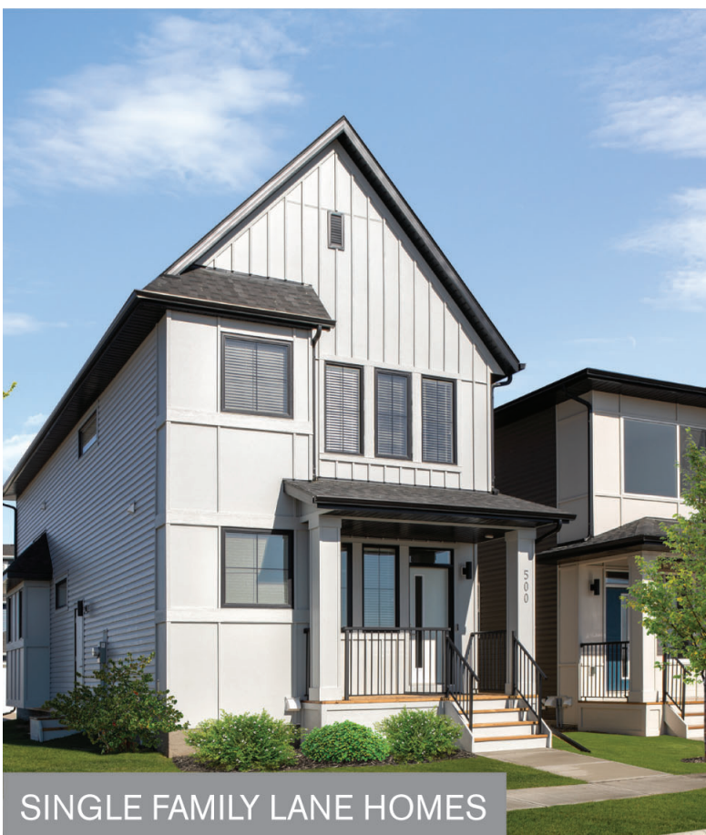
SINGLE FAMILY LANE HOMES