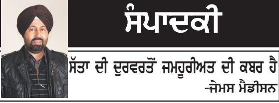
ਸੱਤਾ ਦੀ ਦੁਰਵਰਤੋਂ ਜਮਹੂਰੀਅਤ ਦੀ ਕਬਰ ਹੈ -ਜੇਮਸ ਮੈਡੀਸਨ