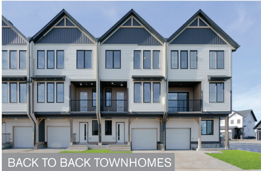
BACK TO BACK TOWNHOMES