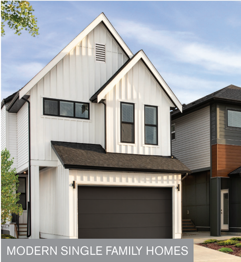
MODERN SINGLE FAMILY HOMES