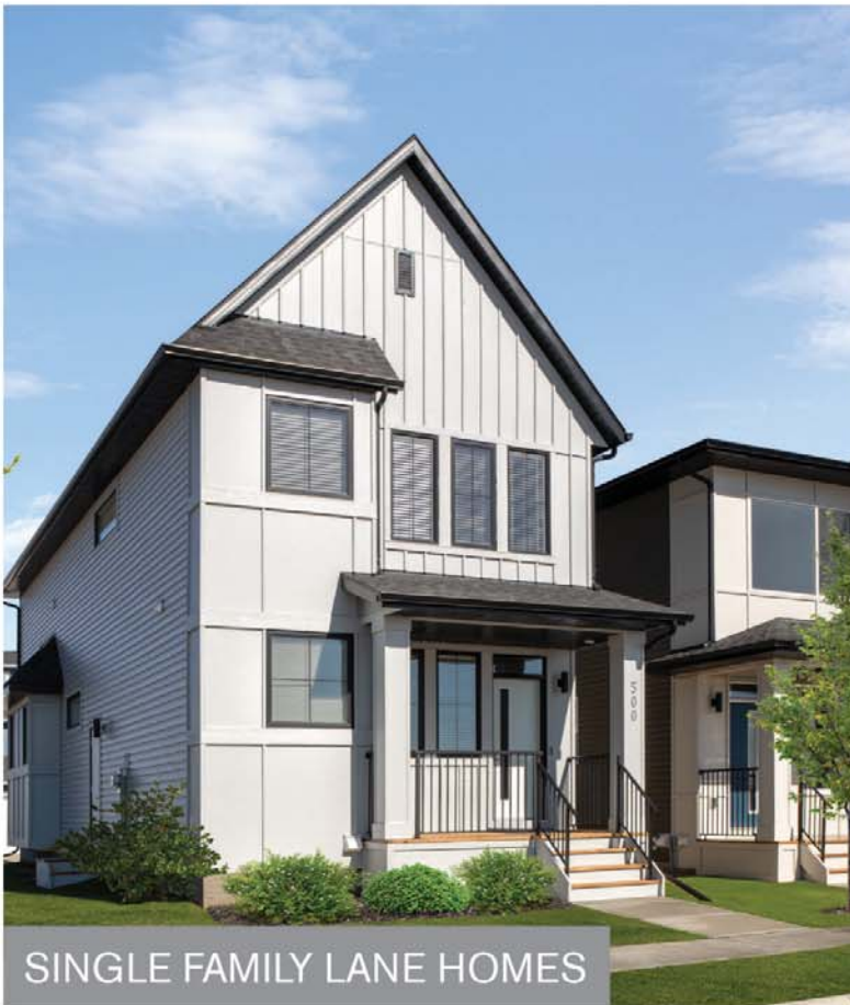
SINGLE FAMILY LANE HOMES