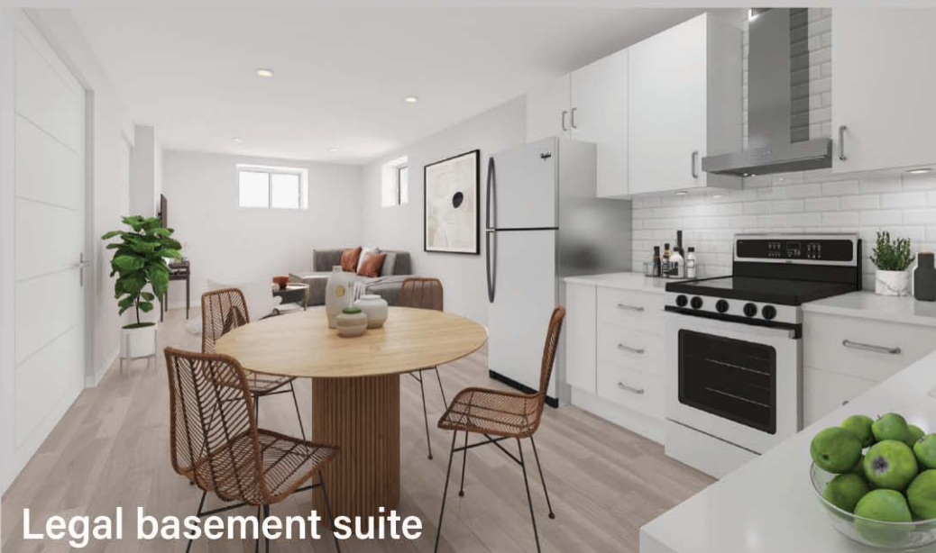
Legal basement suite