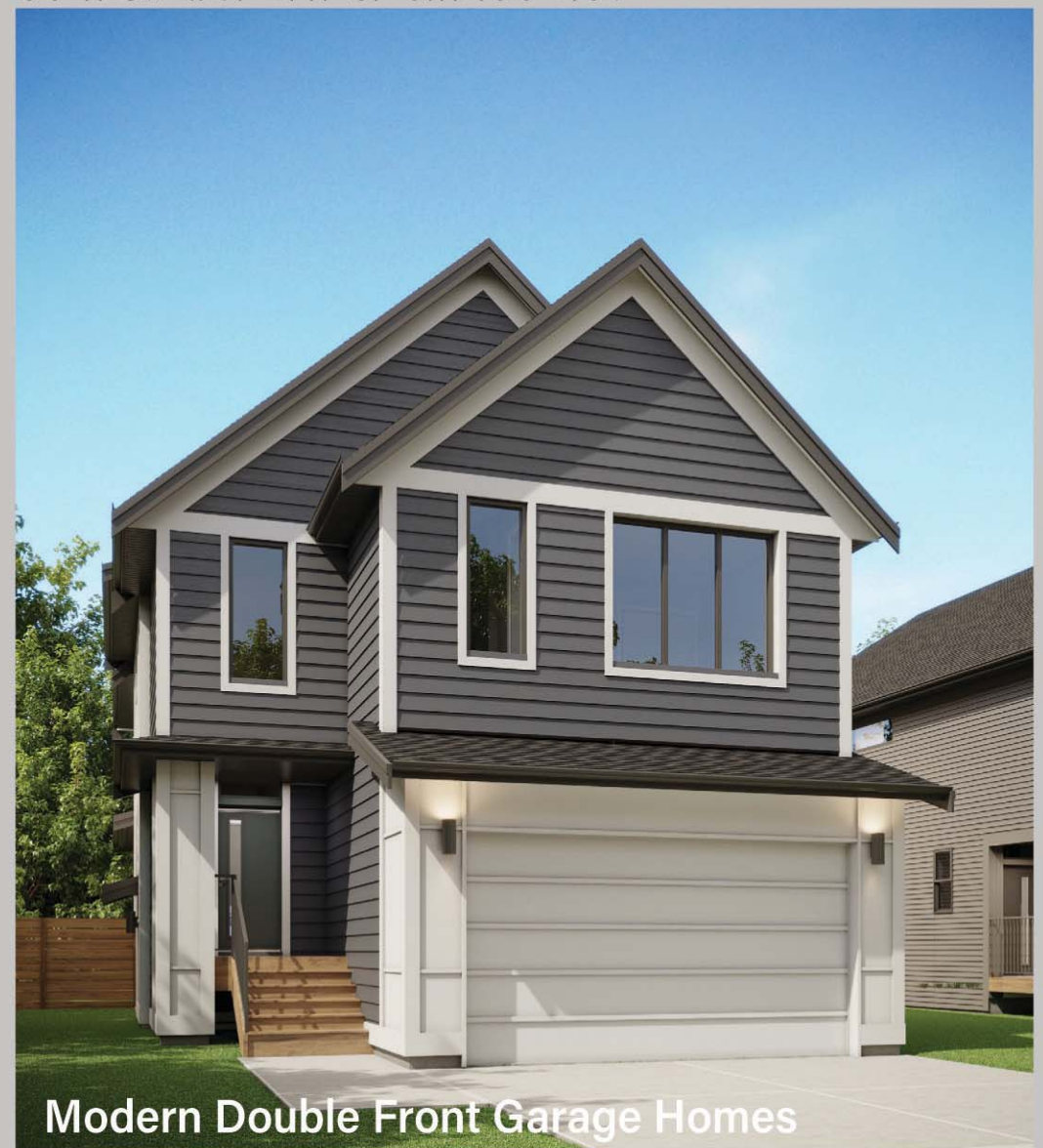
Modern Double Front Garage Homes

SHOWHOMES NOW OPEN 1233 Copperfield Blvd SE, Calgary, AB T2Z 5G1