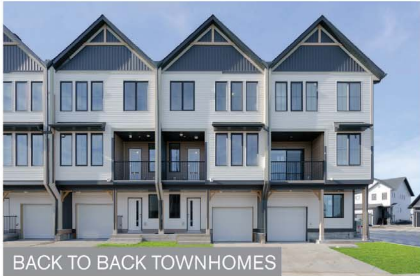
BACK TO BACK TOWNHOMES