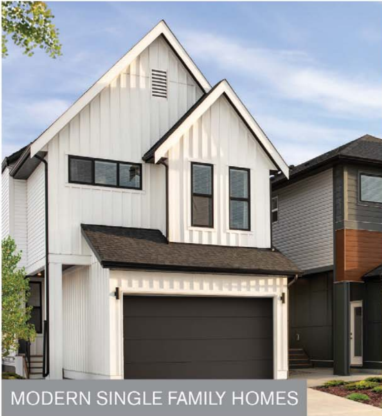
MODERN SINGLE FAMILY HOMES