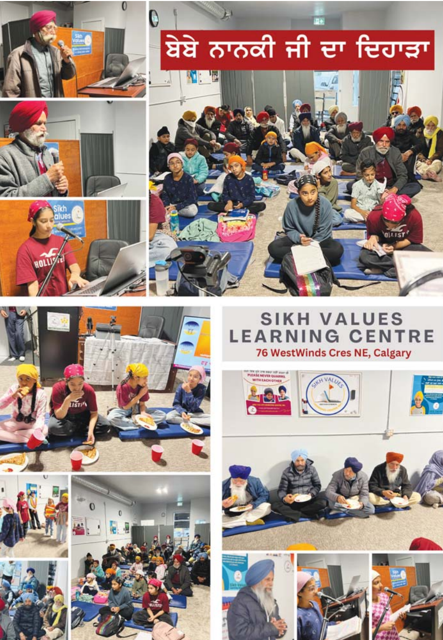
ਬੇਬੇ ਨਾਨਕੀ ਜੀ ਦਾ ਦਿਹਾੜਾ