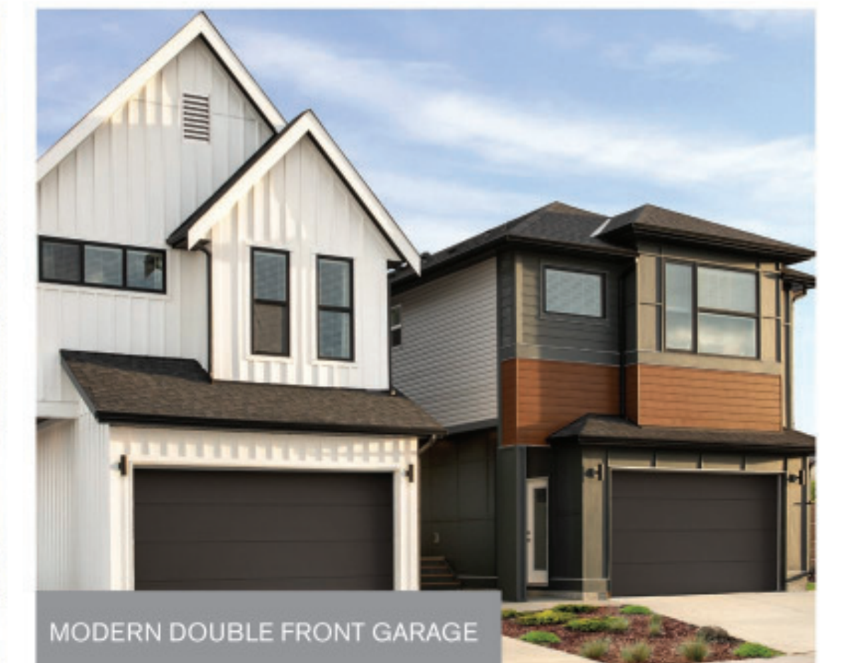
MODERN DOUBLE FRONT GARAGE