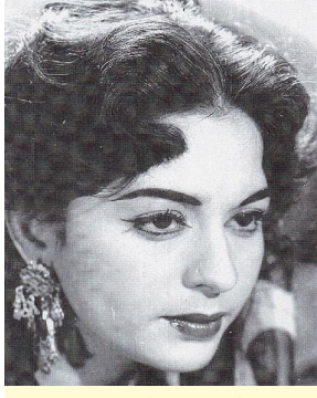
ਦੁੱਖ ਸਾਰੇ ਜਰ ਜਾਂਗੇ ਤੇਰੇ ਬਾਝੋਂ ਬਾਲੂ ਮੇਰੀਏ ਅਸੀਂ ਜਿਉਂਦੇ ਏੀ ਮਰ ਜਾਂਗੇ ਬਾਲੀ ਵਿੱਚ ਖੰਡ ਮਾਹੀਆ