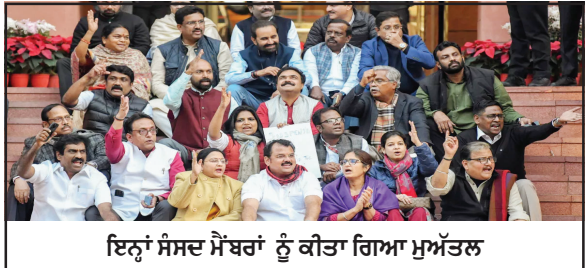
ਇਨ੍ਹਾਂ ਸੰਸਦ ਮੈਂਬਰਾਂ ਨੂੰ ਕੀਤਾ ਗਿਆ ਮੁਅੱਤਲ

ਨਵੀਂ ਦਿੱਲੀ (ਪੰਜਾਬੀ ਅਖਬਾਰ ਬਿਊਰੋ) - ਸੰਸਦ ਦੇ ਸਰਦ ਰੁੱਤ ਸੈਸ਼ਨ ਦੌਰਾਨ ਵਿਰੋਧੀ ਧਿਰ ਦੇ ਸੰਸਦ ਮੈਂਬਰਾਂ ਵਿਰੁੱਧ ਕਾਰਵਾਈ ਦਾ ਸਿਲਸਿਲਾ ਜਾਰੀ ਹੈ। 49 ਹੋਰ ਸੰਸਦ ਮੈਂਬਰਾਂ ਨੂੰ ਲੋਕ ਸਭਾ ਤੋਂ ਮੁਅੱਤਲ ਕਰ ਦਿੱਤਾ ਗਿਆ ਹੈ। ਕੇਂਦਰੀ ਮੰਤਰੀ ਅਰਜੁਨ ਰਾਮ ਮੇਘਵਾਲ ਨੇ ਲੋਕ ਸਭਾ ਵਿਰੋਧੀ ਧਿਰ ਦੇ ਸੰਸਦ ਮੈਂਬਰਾਂ ਨੂੰ ਮੁਅੱਤਲ ਕਰਨ ਦਾ ਪ੍ਰਸਤਾਵ ਰੱਖਿਆ, ਜਿਸ ਤੋਂ ਬਾਅਦ ਵਿਰੋਧੀ ਧਿਰ ਦੇ ਸੰਸਦ ਮੈਂਬਰਾਂ ਨੂੰ ਲੋਕ ਸਭਾ ਤੋਂ ਮੁਅੱਤਲ ਕਰ ਦਿੱਤਾ ਗਿਆ। ਇਨ੍ਹਾਂ ਵਿਚ ਸੰਸਦ ਮੈਂਬਰ ਸੁਪ੍ਰੀਆ ਸੁਲੇ, ਮਨੀਸ਼ ਤਿਵਾੜੀ, ਸ਼ਬੀ ਥਰੂਰ, ਮੁਹੰਮਦ ਵੈਜ਼ਲ, ਕਾਰਤੀ ਚਿਦੰਬਰਮ, ਸੁਦੀਪ ਬੰਧੋਪਾਧਿਆਏ, ਡਿੱਪਲ ਯਾਦਵ, ਦਾਨਿਸ਼ ਅਲੀ ਅਤੇ ਵਿਰੋਧੀ ਧਿਰ ਦੇ ਹੋਰ ਸੰਸਦ ਮੈਂਬਰ ਸ਼ਾਮਲ ਹਨ। ਲੋਕ ਸਭਾ ਕੇਂਦਰੀ ਮੰਤਰੀ ਪ੍ਰਹਿਲਾਦ ਜੋਸ਼ੀ ਨੇ ਕਿਹਾ ਕਿ ਸਦਨ ਦੇ ਅੰਦਰ ਤਖ਼ਤੀਆਂ ਨਾ ਲਿਆਉਣ ਦਾ ਫੈਸਲਾ ਕੀਤਾ ਗਿਆ। ਉਹ ਹਾਲੀਆ ਚੋਣਾਂ ਹਾਰਨ ਤੋਂ ਬਾਅਦ ਨਿਰਾਸ਼ ਹੋ ਕੇ ਅਜਿਹੇ ਕਦਮ ਚੁੱਕ ਰਹੇ ਹਨ। ਇਸ ਲਈ ਅਜੀ ਸੰਸਦ ਮੈਂਬਰਾਂ ਨੂੰ ਮੁਅੱਤਲ ਕਰਨ ਦਾ ਪ੍ਰਸਤਾਵ ਲਿਆ ਰਹੇ ਹਾਂ। ਸੰਸਦ ਦੀ ਸ਼ੁਰੂਆਤ ਵਿੱਚ ਵਿੱਲ ਦੇਣ ਦੀ ਘਟਨਾ ਨੂੰ ਲੈ ਕੇ ਵਿਰੋਧੀ ਧਿਰ ਦੇ ਸੰਸਦ ਮੈਂਬਰਾਂ ਨੇ ਸੰਸਦ ਦੇ ਦੋਵਾਂ ਸਦਨਾਂ 'ਚ ਹੰਗਾਮਾ ਕੀਤਾ ਸੀ। ਜਿਸ ਤੋਂ ਬਾਅਦ ਵਿਰੋਧੀ ਧਿਰ ਦੇ 78 ਮੈਂਬਰਾਂ ਨੂੰ ਲੋਕ ਸਭਾ ਤੋਂ ਰਾਜ ਸਭਾ ਤੋਂ ਮੁਅੱਤਲ ਕਰ ਦਿੱਤਾ ਗਿਆ ਸੀ। ਇਸ ਤੋਂ ਪਹਿਲਾਂ 14 ਸੰਸਦ ਮੈਂਬਰਾਂ ਨੂੰ ਮੁਅੱਤਲ ਕੀਤਾ ਗਿਆ ਸੀ। ਹਾਲਾਂਕਿ ਹੁਣ 49 ਹੋਰ ਸੰਸਦ ਮੈਂਬਰਾਂ ਖਿਲਾਫ ਕਾਰਵਾਈ ਕੀਤੀ ਗਈ ਹੈ।