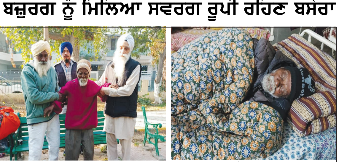
(ਕਿੱਥੇ ਭੁੱਖੇ ਪੇਟ ਸੜਕਾਂ ਕਿਨਾਰੇ ਭੁੱਜੇ ਹੱਡ ਰਗੜਨੇ, ਹੁਣ ਰੱਜਵਾਂ ਭੋਜਨ ਤੇ ਗਏਲਿਆ 'ਤੇ ਸੌਣਾ)