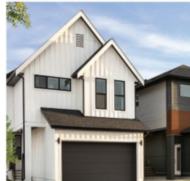
MODERN DOUBLE FRONT GARAGE