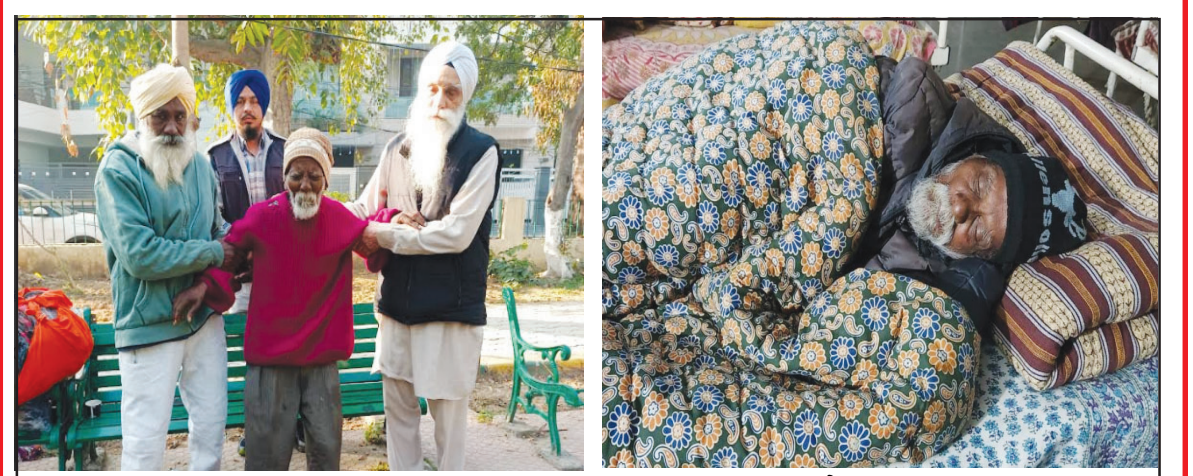
(ਕਿੱਥੇ ਭੁੱਝ ਪੇਟ ਸੜਕਾਂ ਕਿਨਾਰੇ ਭੁੱਜੇ ਹੱਡ ਰਗੜਨੇ, ਹੁਣ ਰੱਜਵਾਂ ਭੋਜਨ ਤੇ ਗਏਲਿਆ 'ਤੇ ਸੌਣਾ)