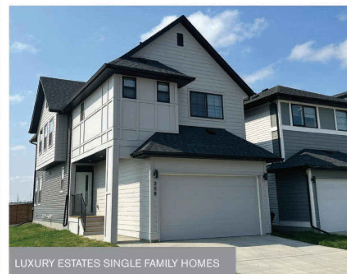
LUXURY ESTATES SINGLE FAMILY HOMES