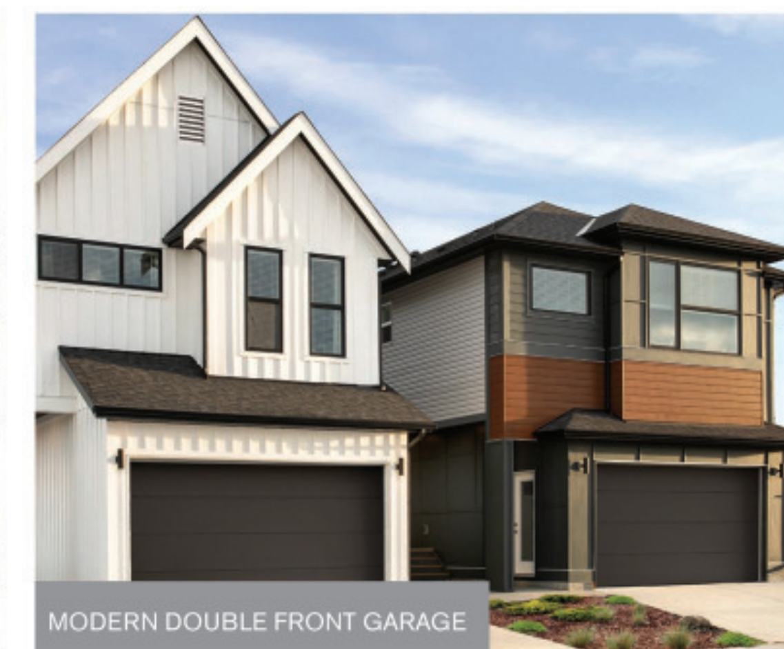
MODERN DOUBLE FRONT GARAGE