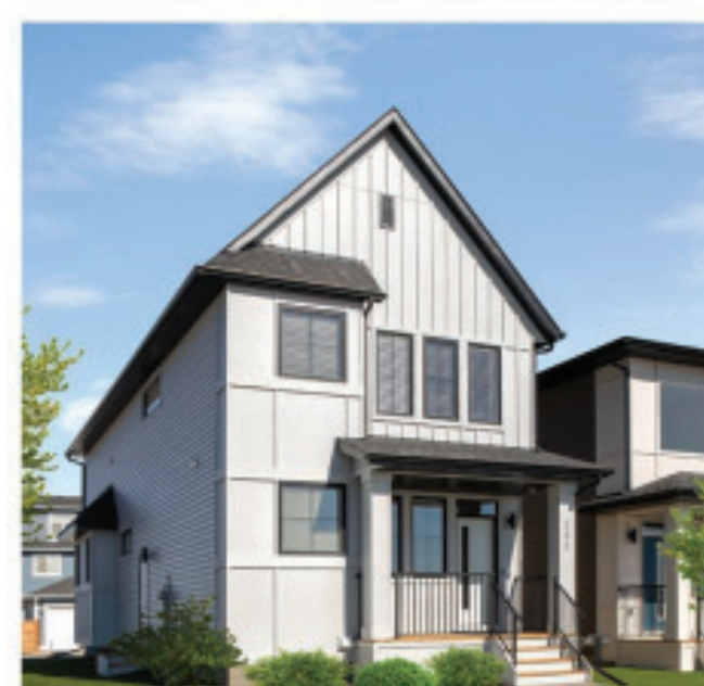
SINGLE FAMILY LANE HOMES