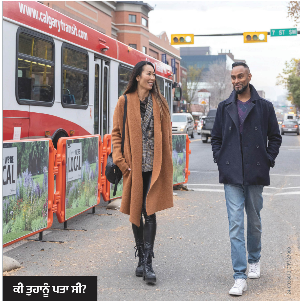
ਕੀ ਤੁਹਾਨੂੰ ਪਤਾ ਸੀ?

ਆਪਣੇ ਪ੍ਰਾਪਰਟੀ ਟੈਕਸ ਦਾ ਮੁਫਤ ਅਨੁਮਾਨ ਪ੍ਰਾਪਤ ਕਰਨ ਅਤੇ ਇਹ ਦੇਖਣ ਲਈ ਕਿ ਤੁਹਾਡੇ ਟੈਕਸ ਡਾਲਰ ਸਿਟੀ ਸੇਵਾਵਾਂ ਅਤੇ ਪ੍ਰੋਗਰਾਮਾਂ ਦਾ ਸਮਰਥਨ ਕਿਵੇਂ ਕਰਦੇ ਹਨ, calgary.ca/taxcalculator 'ਤੇ ਜਾਓ।