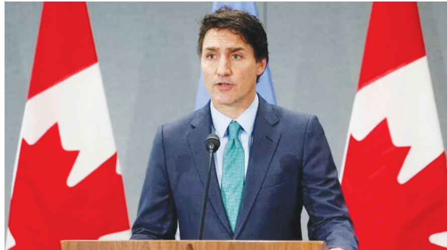
ਰੀਜ਼ਾਇਨਾ (ਪੰਜਾਬੀ ਪੇਸ਼ ਕੀਤੇ ਜਾ ਰਹੇ ਫੈਡਰਲ ਬਜਟ ਟਰੁਡੋ ਨੇ ਐਲਾਨ ਕੀਤਾ ਹੈ ਕਿ ਅਖਬਾਰ ਬਿਉਰੋ) 16 ਅਪ੍ਰੈਲ ਨੂੰ ਤੋਂ ਪਹਿਲਾਂ ਪ੍ਰਧਾਨ ਮੰਤਰੀ ਜਸਟਿਨ ਅਗਲੇ ਪੰਜ ਸਾਲਾਂ ਦੇ ਦੌਰਾਨ ਨੈਸ਼ਨਲ

ਫੂਡ ਪ੍ਰੋਗਰਾਮ ਉੱਪਰ ਇੱਕ ਬਿਲੀਅਨ ਡਾਲਰ ਖਰਚ ਕੀਤੇ ਜਾਣਗੇ। ਟਰੁਡੋ ਵਿੱਚ ਇਹ ਐਲਾਨ ਕਰਦਿਆਂ ਪ੍ਰਧਾਨ ਮੰਤਰੀ ਨੇ ਆਖਿਆ ਕਿ ਇਸ ਨਾਲ ਹੋਰ 4 ਲੱਖ ਬੱਚਿਆਂ ਨੂੰ ਹਰ ਸਾਲ ਭੋਜਨ ਮੁਹਈਆ ਕਰਵਾਇਆ ਜਾਵੇਗਾ। ਇਹ ਐਲਾਨ ਕਰਨ ਮੌਕੇ ਉਹਨਾਂ ਦੇ ਨਾਲ ਵਿੱਤ ਮੰਤਰੀ ਕ੍ਰਿਸਟੀਆ ਫਰੀਲੈਂਡ ਅਤੇ ਪਰਿਵਾਰ ਬਾਰੇ ਮੰਤਰੀ ਜੇਨਾ ਸਡਸ ਵੀ ਮੌਜੂਦ ਸਨ। ਵਰਨਣ ਯੋਗ ਹੈ ਕਿ ਜਦੋਂ ਐਜੂਕੇਸ਼ਨ ਫੈਡਰਲ ਸਰਕਾਰ ਦੇ ਅਧੀਨ ਨਹੀਂ ਹੁੰਦੀ ਤਾਂ ਨੈਸ਼ਨਲ ਪ੍ਰੋਗਰਾਮ ਦੇ ਤਹਿਤ ਫੈਡਰਲ ਸਰਕਾਰ ਸੁਬਾਈ ਸਰਕਾਰਾਂ ਦੇ ਟੈਰੇਟਰੀਜ਼ ਨਾਲ ਮਿਲ ਕੇ ਇਸ ਪ੍ਰੋਗਰਾਮ ਨੂੰ ਚਲਾਉਂਦੀ ਹੈ।