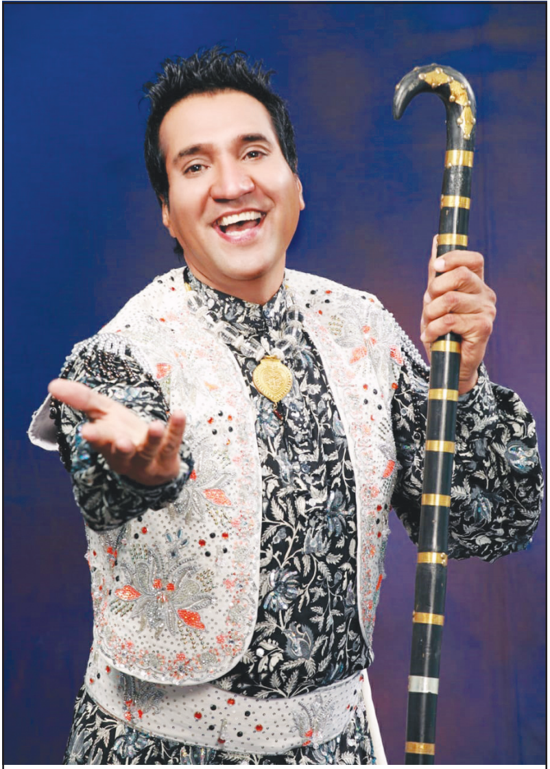
ਗਾਇਕ ਸਤਵਿੰਦਰ ਬੁੱਗਾ

ਵੀ ਗਾਇਕੀ ਦੇ ਖੇਤਰ 'ਚ ਅਮਿੱਟ ਪੈੜਾਂ ਪਾ ਰਿਹਾ ਹੈ। ਸੰਗੀਤ ਜਗਤ ਦੇ ਸਿਤਾਰੇ ਲੋਕ ਗਾਇਕ ਸਤਵਿੰਦਰ ਬੁੱਗਾ ਨੇ ਜਿੱਥੇ ਗੀਤ, ਸੰਗੀਤ ਵਿੱਚ ਆਪਣੇ ਹਿੱਟ ਗੀਤਾਂ ਨਾਲ ਆਪਣੀ ਬੁਲੰਦ ਆਵਾਜ਼ ਵਾਲੀ ਗਾਇਕੀ ਨਾਲ ਘੇਰਾ ਵਿਸ਼ਾਲ ਕੀਤੀ ਹੈ। ਉਸ ਕੋਲ ਸਟੇਜਾਂ ਦੀ ਸ਼ਾਨ ਬਣ ਮੇਲਾ ਲੁੱਟਣ ਦੀ ਕਲਾ ਹੈ, ਉੱਥੇ ਹੀ ਹਰ ਦਿਲ ਅਜੀਜ਼ ਸਤਵਿੰਦਰ ਬੁੱਗਾ ਯਾਰਾਂ ਦਾ ਯਾਰ ਵੀ ਹੈ। ਯਾਰਾਂ ਦੀ ਮਹਿਫਲਾਂ ਦੀ ਰੌਣਕ ਬਣ ਜਾਂਦਾ ਹੈ। ਤਮਾਮ ਦਿਲਾਂ 'ਚ ਵਸਦਾ ਪੰਜਾਬੀਆਂ ਦਾ ਹਰਮਨ ਪਿਆਰਾ ਗਾਇਕ ਸਤਵਿੰਦਰ ਬੁੱਗਾ ਵਲੋਂ ਹਾਲ ਹੀ 'ਚ ਨਵੇਂ